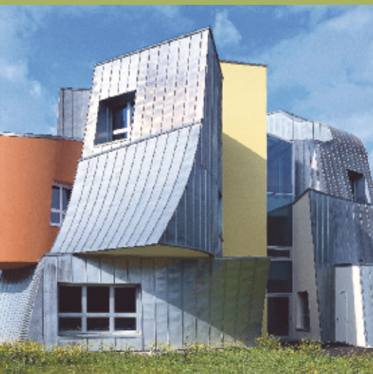
Hauptsitz der Firma Vitra AG