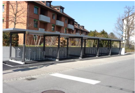
Der neue Velounterstand steht zur Nutzung bereit

Wir freuen uns, mit dieser Abstellanlage einen Beitrag zur Förderung des umweltfreundlichen Verkehrs zu leisten.