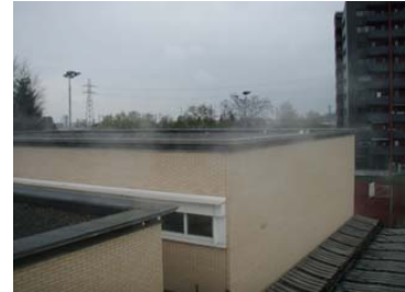
Auf diesen Dachflächen des Schulhauses Donnerbaum wird die Fotovoltaikanlage parallel zum Dachrand angeordnet.

Auch mit diesem Projekt bleibt der Gemeinderat beispielgebend auf dem energiepolitischen Gleis in Richtung nachhaltiger Energiebeschaffung. Wie gesagt, für die Energiestadtgemeinde Muttenz sind Zukunftssicherheit und umweltschonende Energieversorgung kein Widerspruch. Und umweltschonende Energieeffizienz ist keine Strategie zur Gefährdung des Wohlstands.