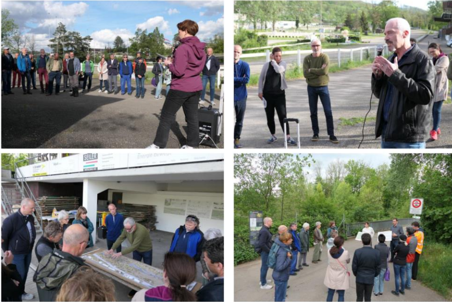
Abbildung 2: Informationsveranstaltung auf dem Schänzli-Areal