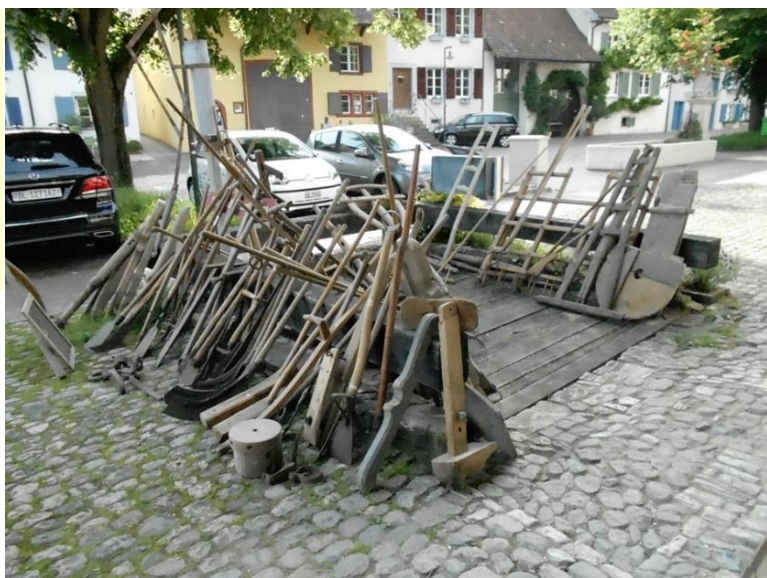
Auslagerung vor dem BHM

Im April und im Mai startete die AGM je ein Inserat, in dem neugierige und historisch interessierte Mitglieder für die AGM gesucht wurden. Das aktuell gute 68 Jahre zählende Durchschnittsalter und die immer zahlreicher werdenden „Gebrechen“ einiger Mitglieder machen die Nachwuchssuche dringend. Leider gab es keine einzige Rückmeldung, somit bleibt