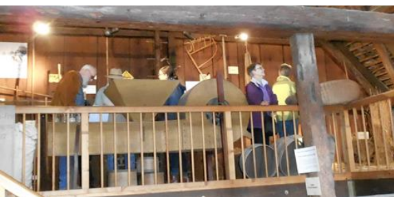
Die AGM in der Scheune des Landwirtschaftsmuseum in Weil

Am 21. Oktober zog die AGM mittels ÖV ins benachbarte Weil am Rhein. Dort liessen wir uns von zwei Fachfrauen durch das Museum am Lindenplatz und das Landwirtschaftsmuseum führen. Wie wir feststellten, haben auch die dortigen Museen die gleichen Probleme wie alle anderen nämlich wenig Besucher und Besucherinnen. Dies obwohl es im Museum im ehemaligen Schul- und späteren Gemeindehaus jedes Jahr eine neue, thematisch anders fundierte Ausstellung gibt, die eigentlich neue Interessengruppen anziehen sollte. Es scheint eine Zeiterscheinung zu sein, dass jüngere Leute keine Museen mehr besuchen. Auch im dortigen Landwirtschaftsmuseum, welches viel kleiner ist als unser BhM, fehlen die Gäste, wenn nicht grad eine grössere Veranstaltung wie Waschttag oder ähnliches stattfindet. Hier erschliesst sich die Ausstellung nur durch eine Führung, welche die nötigen Grundlagen vermittelt. Da konnte die AGM stolz erzählen, dass für unsere eigene landwirtschaftliche Ausstellung ein Führer besteht, mit dem sich die Gäste selbständig bewegen und dabei die Erklärungen lesen können, die sie wünschen.