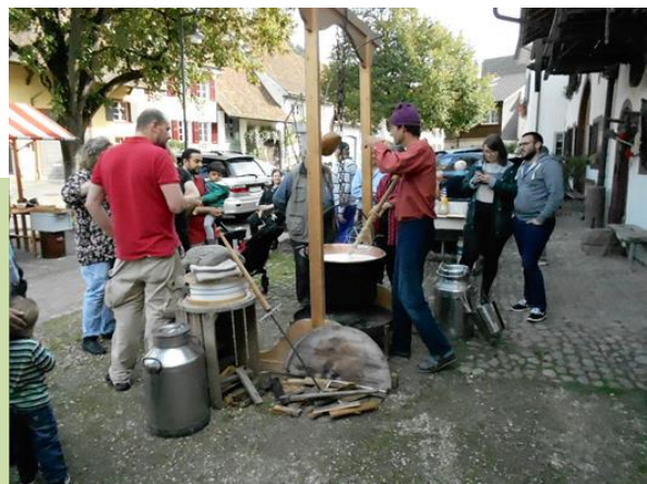
Traditionelles Käsen am Arbeitstag

Spezialgast war in diesem Herbst ein Käser aus Fehren. Glücklicherweise war es ein wunderschöner Tag mit stabilen Temperaturen, denn ohne das hätte die Rohmilch kaum auf die erforderliche Temperatur von 38 Grad geheizt werden können. Danach wurde mit einer speziellen Bakterienmischung der Gerinnungsprozess