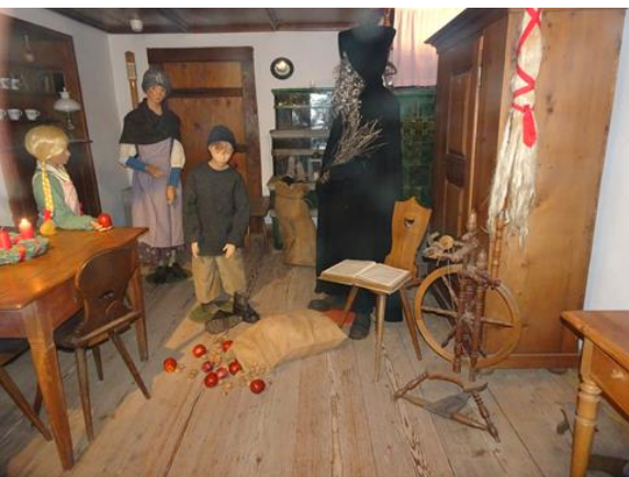
Die Adventsstube im BhM

Mitte Monat waren leider die historischen Vereinsfahnen immer noch nicht aufgehängt worden. Denn ausgerechnet am Platz der doppelten, von Karl Jauslin bemalten Seidenfahne aus der Gründungszeit des Turnvereins, waren das Durchgangsloch in den Estrich und die Ausziehtreppe nur rund 20 cm entfernt. Die Gefährdung durch Montagearbeiten an der sperrigen Treppe wäre zu gross gewesen. Darum wartete die AGM mit dem Reinigen der restlichen Räume ab.