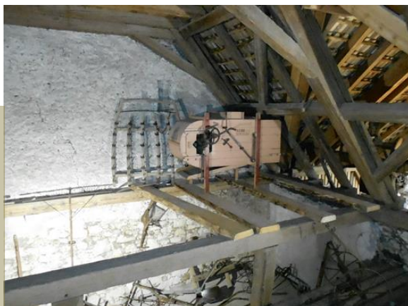
Die Röndle auf ihrem „Hochsitz“ mit neuer Beleuchtung für die Pflüge auf der darunterliegenden Heubühne

Am vorletzten September-Weekende fand dann die Eröffnung des renovierten Schulhauses Breite und der neuen Räume im Feuerwehrgebäude statt. Natürlich war die AGM nun auf den Liftzugang gespannt, der das Leben sicher vereinfachen wird. Nicht nur die Gäste sind älter geworden, nein auch die AGM selber wird nun vom bequemen Aufstieg in die Museumsetage profitieren. Leider wurden