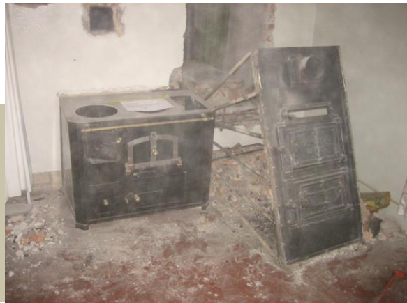
Aus der Mauer herausgespitzt der Feuerherd und die Front des Peter-Ofens

Den zweiten Teil des Inventarisierungsprojektes im BhM schloss Beat Zimmermann nach einer weiteren intensiven Arbeitswoche ab. Somit sind in beiden Museen nun alle Objekte in der Inventardatenbank erfasst.