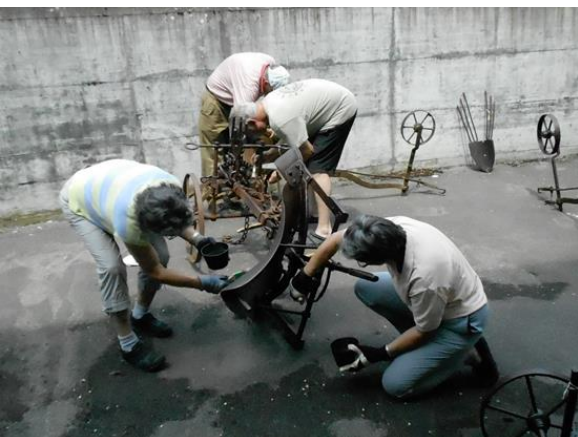
Fördervereinsmitglieder stellen die rostigen Pflüge instand