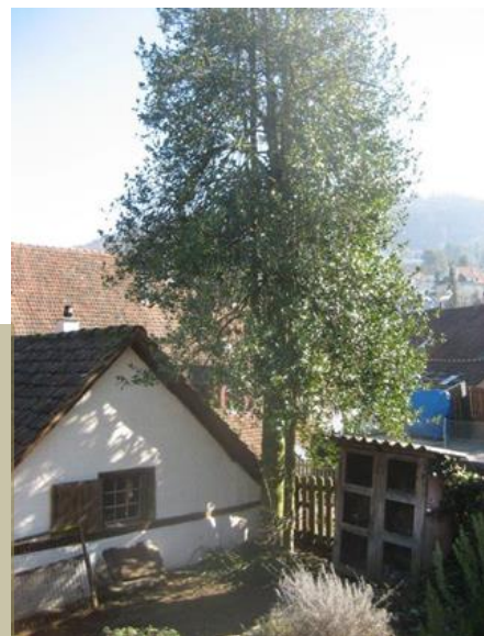
Die Gartenecke im BhM mit der Stechpalme sieht wieder gepflegt aus

Oberdorf 4, am noch jungen Baum jeweils zur Weihnachtszeit Äste mit roten Beeren abgeschnitten und sie auf dem Markt in Basel verkauft. Nach seinem Tod war aber nichts mehr geschnitten worden. Inzwischen überwucherten die langen Äste den darunter stehenden „Chüngeli-Stall“ und dürre, stachelige Blätter und Moos verstopften die Dachrinne des Werkstattanbaus. Ruedi Bürgin auf der einen Seite des Gartenhages und Matthias Schütz auf der anderen Seite stutzten in gut nachbarschaftlichem Einvernehmen die langen Äste zurecht und entfernten alles herumliegende dürre und stachelige Blattwerk. Nun sieht diese Gartenecke wieder sauber und gepflegt aus. Das bereitgestellte Ast- und Blattwerk füllte den ganzen ehemaligen Miststock vor dem BhM und wurde von den Gemeindegärtnern abgeführt. Herzlichen Dank an alle Beteiligten.