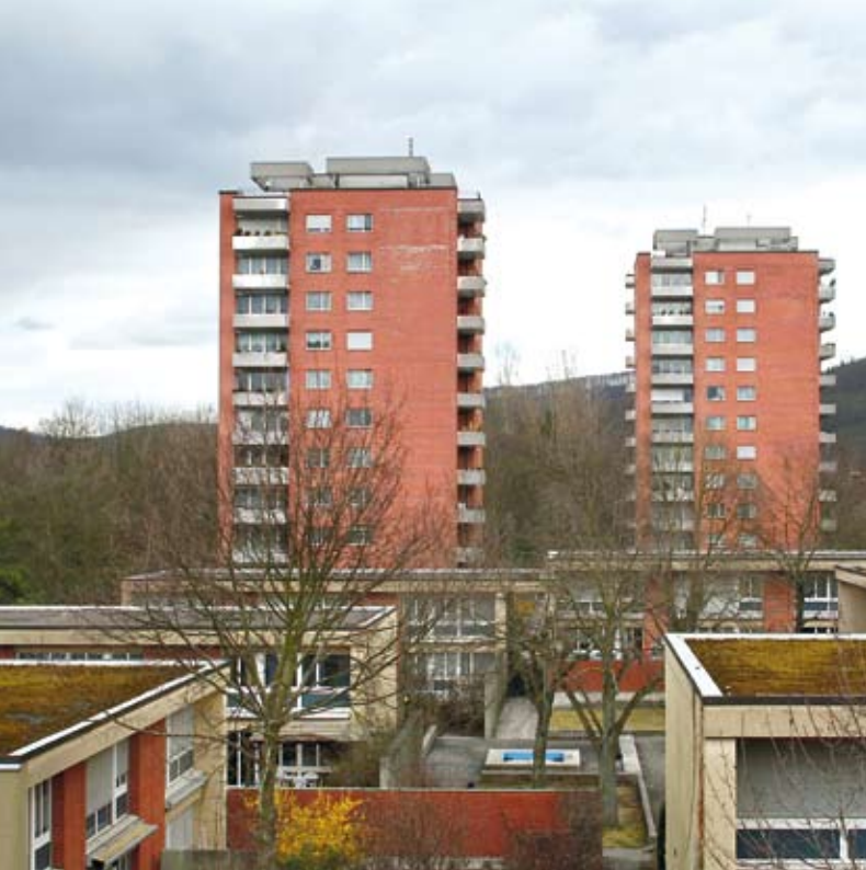
Hochhäuser in der Kilchmatt