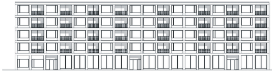
Haus 3: Ansicht Süd