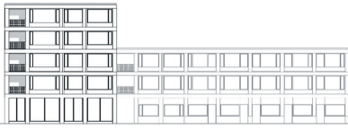
Haus 3: Ansicht Ost