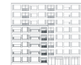
Haus 1: Ansicht West