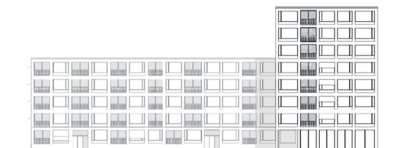
Haus 1: Ansicht Süd

Fassadenansichten Richtprojekt, Hauptbaute in den Baubereichen B1 und B2, Stand 16.08.2018