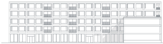
Haus 3: Ansicht Nord