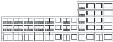
Haus 3: Ansicht West