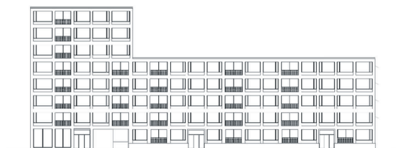
Haus 1: Ansicht Nord