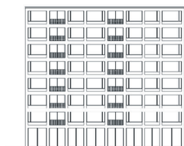
Haus 1: Ansicht Ost