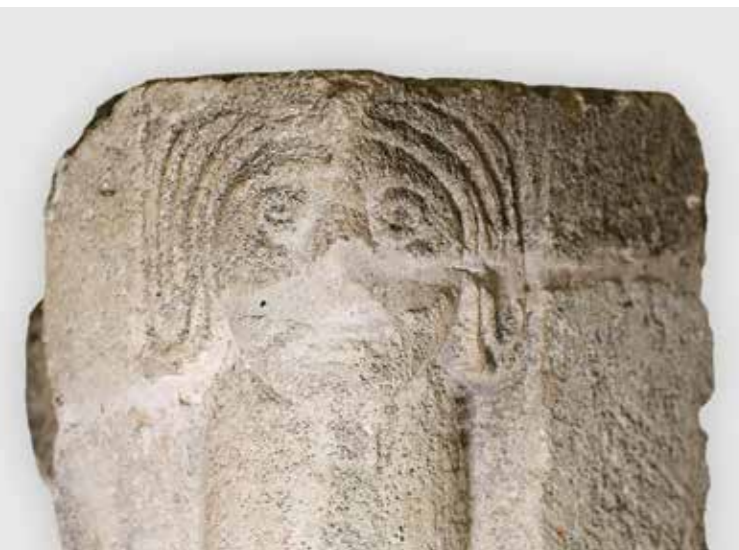
Im Bereich der mutmasslichen Kapelle der Vorderen Burg wurden Säulchen mit Gesichtskapitellen geborgen. Auf Grund von Parallelen im Basler Münster und im Elsass datieren sie ins späte 12. Jahrhundert.

Kontaktadresse: Gesellschaft pro Wartenberg, 4132 MuttENZ info@wartenberg.ch www.wartenberg.ch