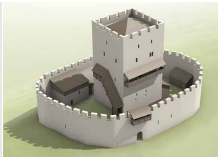
Die zeichnerische Rekonstruktion der Mittleren Burg auf dem Wartenberg zeigt eine Möglichkeit, wie die Burg einmal ausgesehen haben könnte. Ansicht von Osten (Zeichnung Joe Rohrer).

Die Burg war ursprünglich von einer Ringmauer umgeben, von der heute jedoch keine Reste mehr erhalten sind. Hauptbau ist der repräsentative Wohnturm. Eine Zisterne wird für die Wasserversorgung von Menschen und Vieh gesorgt haben.