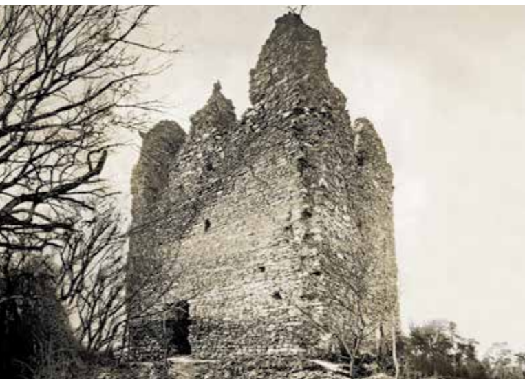
Eine Postkarte zeigt den Zustand der Mittleren Wartenberg vor der Restaurierung von 1934. Einige der Risse könnten im Erdbeben von 1356 entstanden sein.

Der Eingang lag im zweiten Obergeschoss. Hier befand sich ein repräsentativer Saal, in dem der Burgherr sein Amt ausübte und Gäste empfing. Im dritten Obergeschoss lagen wohl die kostbar ausgestatteten Wohnräume des Burgherrn. Darüber folgte ein weniger aufwändig ausgestattetes Stockwerk mit Kammern für Bedienstete und Lagerräumen.