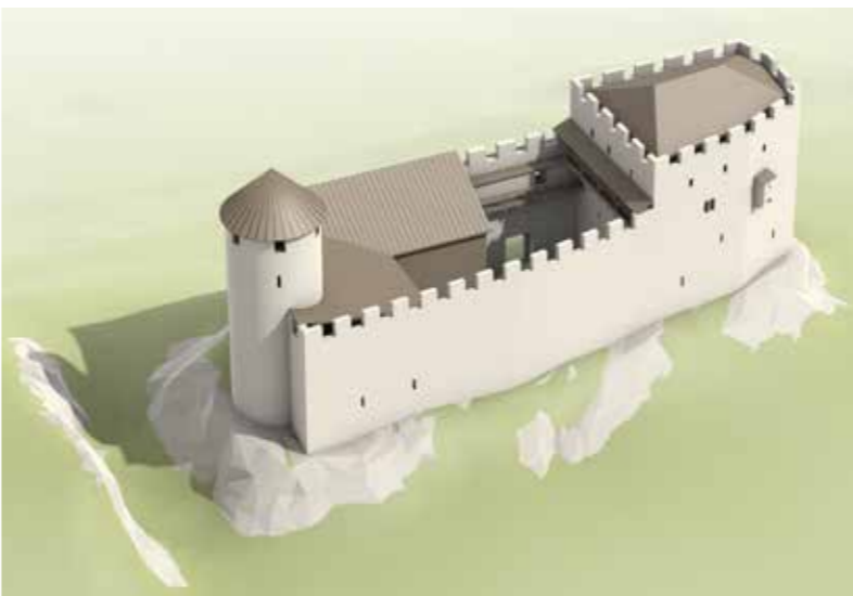
Versuch einer zeichnerischen Rekonstruktion der Hinteren Burg auf dem Wartenberg mit Rundturm und mächtigem Palas. Ansicht von Westen (Zeichnung Joe Rohrer).

Der Eingang im Osten ist in seiner heutigen Form eine Rekonstruktion von 1936, entspricht aber dem originalen Zugang. Im Innern sind mehrere Wohnbauten für Bedienstete sowie Ställe, Scheunen und Werkstätten anzunehmen. Sicherlich gab es eine Zisterne und vielleicht auch ein Wasch- oder Badehaus.